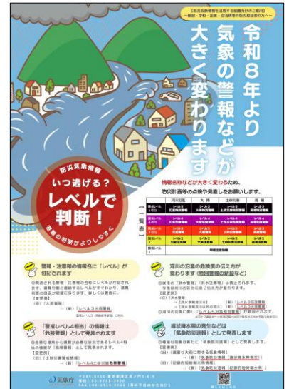
気象庁「新たな防災気象情報について（令和8年～）」